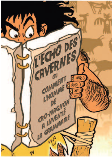
Spectacle jeune public Un conte préhistorique sur l'origine du langage